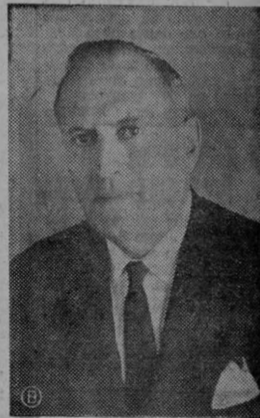
Dr. R. A. Calderón Guardia Presidente del Partido Republicano.

"El Comité Cantonal de Montes de Oca, convencido de que el Partido Republicano ha sabido llevar esta campaña con discreción y patriotismo, cree que ha llegado el momento de entrar en un período pre-eleitoral en que se defina el nombre de la persona que se designará Candidato Presidencial.